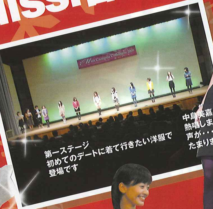
第一ステージ 初めてのデートに着て行きたい洋服で 登場です