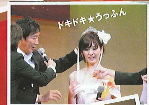
ドキドキ★うっぶん