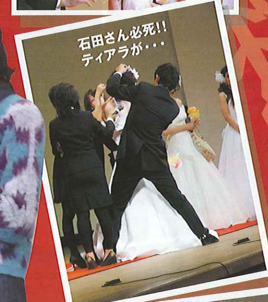
石田さん必死!! ティアラが...