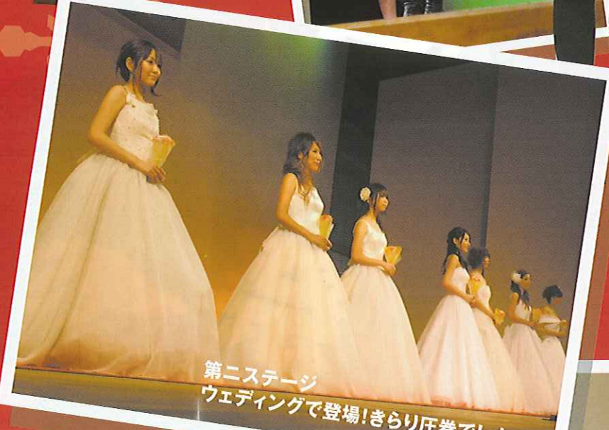
第二ステージ ウェディングで登場!きりり圧巻でした