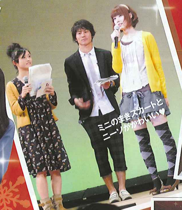
ミニの幸きスカートと ニーソがかわいい♡