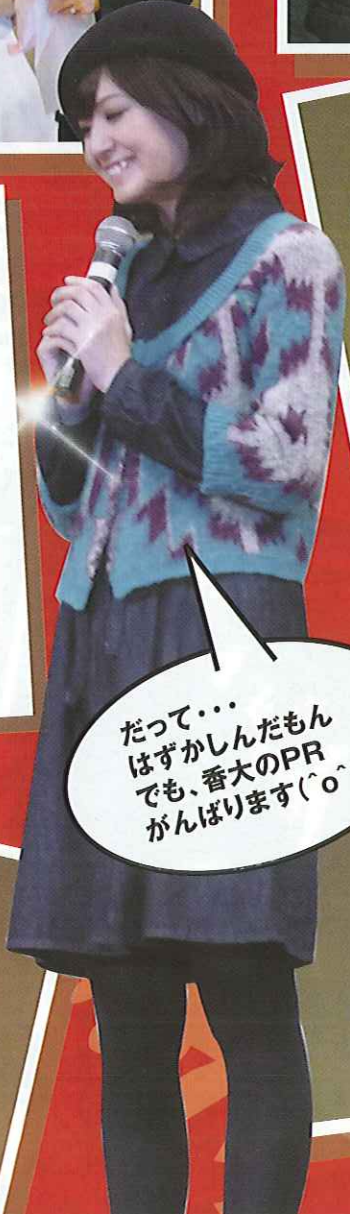
だって… はずかしんだもん でも、香大のPR がんばります(°o°)v